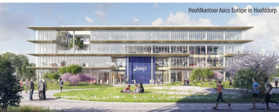
Hoofdkantoor Asics Europe in Hoofddorp