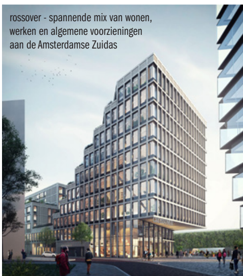
rossover - spannende mix van wonen, werken en algemene voorzieningen aan de Amsterdamse Zuidas