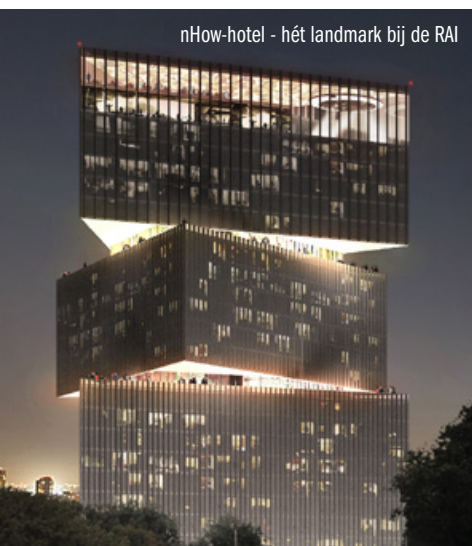
nHow-hotel - hét landmark bij de RAI