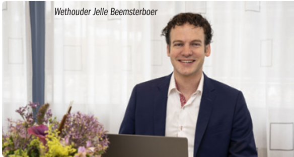
Wethouder Jelle Beemsterboer