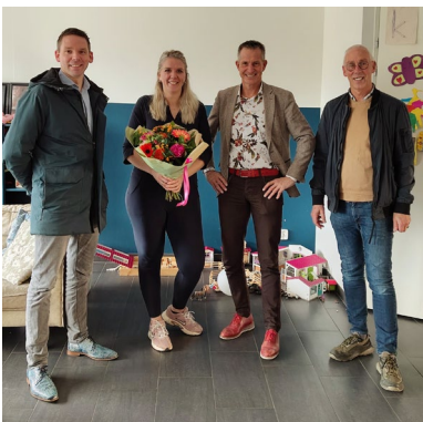
Dag van de Ondernemer

3) Ruimte voor de ontwikkeling van agribusiness. Dit betekent het optimaal faciliteren van ondernemers in de agribusiness (van agrariër tot zaadveredelingsbedrijf en toeleverancier) om ontwikkelingen in onder meer schaalgrootte en duurzaamheid mogelijk te maken.