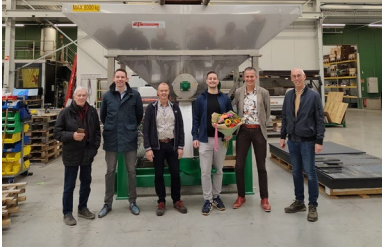
Dag van de Ondernemer