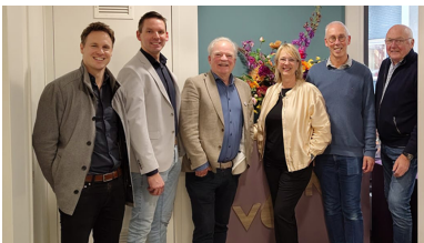
College gemeente Schagen en OFS op bezoek bij Vonk