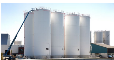
Sector Industrie & Bedrijven