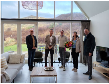
Dag van de Ondernemer