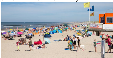
Sector Recreatie & Toerisme