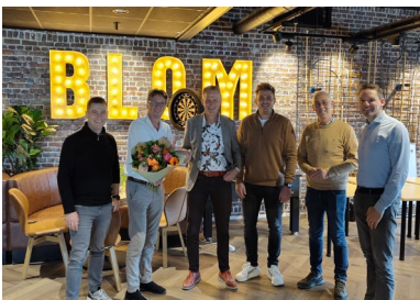
Dag van de Ondernemer