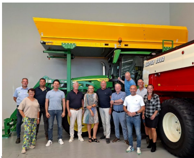
College gemeente Schagen en OFS op bezoek bij Kraakman