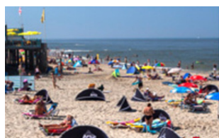
Recreatie & Toerisme

Nu gemeenten zeer recent hebben besloten om vanaf 1.1.2016 alle gelden die ze gereserveerd hadden voor de Regio VVV in te zetten voor de promotie van het gebied: 'HBA: Holland Boven Amsterdam' blijft er voor het lokaal gastheerschap en de informatievoorziening niets meer over. Deze laatste twee eisen stonden altijd boven aan het gemeentelijke prioriteitenlijstje waarbij de Regio VVV de uitvoerende taak moest realiseren. De besluitvorming is razendsnel gegaan. De sector en de politiek zijn er niet over geïnformeerd. De gemeente int jaarlijks € 100.000,- extra toeristenbelasting, oplopend tot € 300.000,- structureel in 2018. Hier zien wij helaas niets van terug. Inmiddels hebben wij een gesprek gevoerd met de wethouder. Een van de actiepunten was dat wij onze achterban zouden consulteren. Deze inventarisatie heeft inmiddels plaatsgevonden. Het bestuur heeft een mening gevormd die wij woensdag 20 januari in de Commissie Bestuur zullen uitspreken. Door de sector zijn een aantal interessante punten naar voren gebracht die wij hebben meegenomen. De tekst is vooraf gemaild binnen de sector. Dat de promotie van ons gebied nu goed op de rit wordt gezet vinden wij een goede zaak. In het verleden was er te veel versnippering en dit wordt nu professioneel aangepakt.