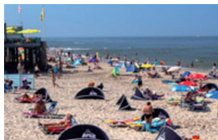
Recreatie & Toerisme

Op 4 oktober jl. hebben de commissieleden van de OFS sector Recreatie&Toerisme met alle 8 VVV I-points een constructieve bijeenkomst gehad. Het eerste jaar verliep verre van vlekkeloos. De belangrijkste klachten waren: men moest zelf achter (lokale) informatie aan, foldersverspreiders wisten de I-points niet te vinden en er waren geen wandel- en fietsroutes beschikbaar. Als sector kunnen wij ons deze klachten absoluut niet veroorloven. Aan al deze klachten gaan wij, samen met de marketing organisatie Holland boven Amsterdam, werken. Deze winter zullen wij actie ondernemen, zodat de I-points voor de aanvang van het seizoen 2017 goed zijn uitgerust. Een van de belangrijkste zaken richting onze gasten is gastheerschap. Ik kan jullie melden dat er in het voorjaar van 2017 cursussen worden georganiseerd door Holland boven Amsterdam. Zo gauw er meer bekend is zullen wij u hierover berichten.