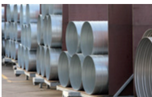
Industrie & Bedrijven

Het derde punt heeft te maken met het functioneren van de sector en dan met name de wisselwerking tussen het sectorbestuur en de ondernemersverenigingen. Over dit onderwerp gaat het bestuur van de sector I&B binnenkort met de ondernemersverenigingen in gesprek. Dan zullen we ook kijken of hierover goede afspraken kunnen worden gemaakt.